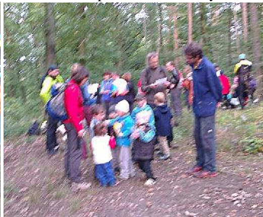
Hromadné odměňování po výkonu se samozřejmě týkalo i rodičů ☺