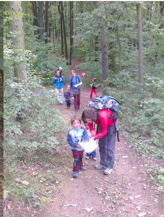
Na kontrolách jsme se naučili i některá písmenka z abecedy..