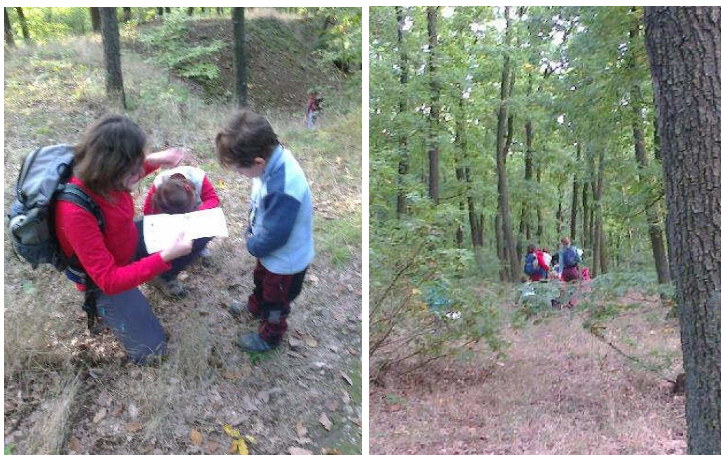
Po poradě hned na další kontrolu.

Žabičky se ani v Kohoutovicích na tréninku společném se žactvem neztratily. Počasí předvedlo krásné Babí léto, kontroly byly na svých místech, a tak lze říct, že se celkově výprava opět vydařila.